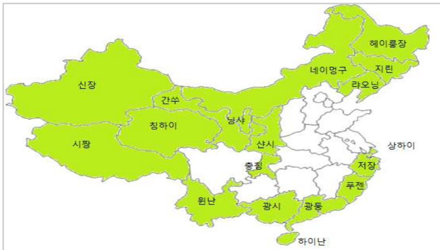
그림 1. '일대일로' 대상 18개 지역 분포도

주: 「실크로드 경제벨트 및 21세기 해상 실크로드 공동 건설 추진을 위한 비전과 행동(推动共建丝绸之路经济带和21世纪海上丝绸之路的愿景与行动)」에 언급된 지역 중 31개 성시(省市)에 해당하는 지역 기준이며, 성(省)의 하급 행정구역인 지급시 단위 제외.