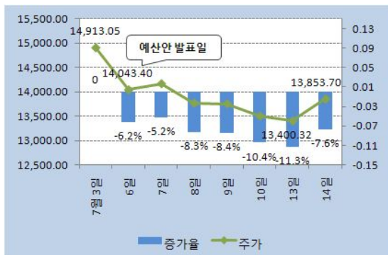
그림 1. 증시 변동추이 및 평가