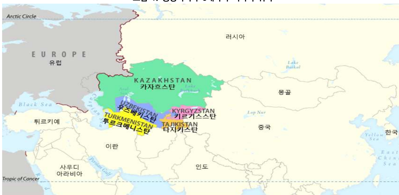
그림 1. 중앙아시아 5개국의 지리적 위치