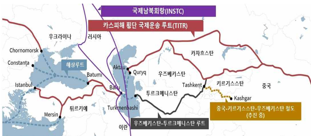
그림 4. 카자흐스탄이 개발 중인 국제운송루트

자료: German Institute for International and Security Affairs(2022), "Russia's War on Ukraine and the Rise of the Middle Corridor as a Third Vector of Eurasian Connectivity." 에 저자 국제남북회랑 보강