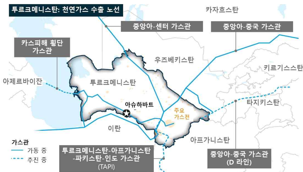
그림 5. 투르크메니스탄 가스관