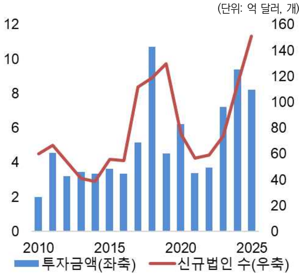
그림 1. 한국의 대인도 해외직접투자 금액 및 신규법인 수