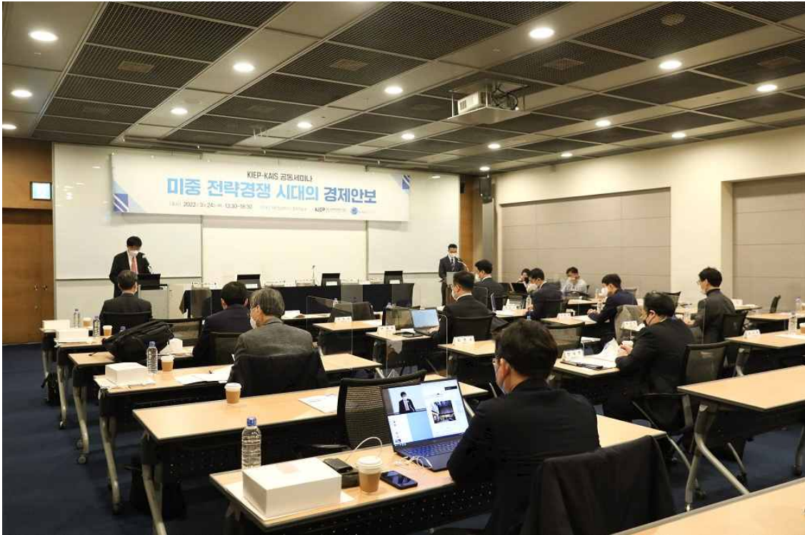
[사진 4] 세미나 현장사진

▲대외경제정책연구원은 3월 24일(목) 서울 대한상공회의소에서 “미중 전략경쟁 시대의 경제안보”를 주제로 한국국제정치학회와 ‘KIEP-한국국제정치학회 공동 세미나’를 개최했다.